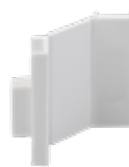
STAS cliprail max Kombikappe weiß RY10100 (2 x Endkappe / 1 x Eckkappe)