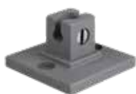
STAS qubic pro TCS1010