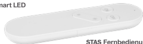
STAS Fernbedienung für STAS W-LAN Smart LED VT40800