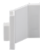
STAS cliprail max combi cap bianco RY10100 (2 x tappo finale / 1 x tappo ad angolo)