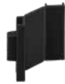
STAS cliprail max combicap nero RY20300 (2 x tappo finale / 1 x tappo ad angolo)