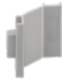
STAS cliprail max combi cap allu RY30100 (2 x tappo finale / 1 x tappo ad angolo)