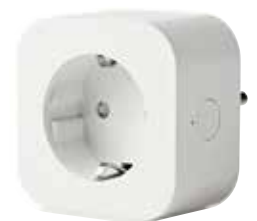
STAS Wi-Fi smart plug VT30700