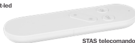
STAS telecomando per STAS Wi-Fi smart-led VT40800