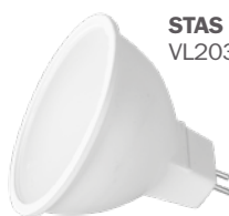
STAS Wi-Fi smart-led VL20300