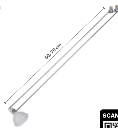
STAS multirail armatura GU5.3 classica chrome incl. STAS Wi-Fi smart-led VA35516 50 cm VA35716 70 cm