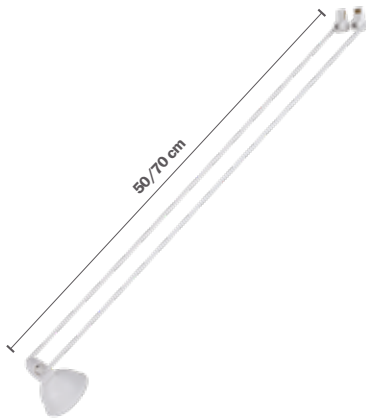
STAS multirail armatura GU5.3 classica bianca incl. STAS Wi-Fi smart-led VA15516 50 cm VA15716 70 cm

Queste 3 armature diverse sono appositamente progettate per essere utilizzate con i sistemi STAS Wi-Fi smart LED e gli STAS multirail. È facile montare la STAS lampada Wi-Fi smart LED sull'armatura con la chiave a brugola in dotazione. Dopodiché puoi cliccare a qualsiasi posto desiderato l'armatura nello STAS multirail. L'armatura Classica può essere regolata solo in altezza e puoi girare la base. L'armatura Sirius ha una sezione flessibile con la quale riuscirai a fare dei piccoli aggiustamenti nella direzione del fascio di luce.