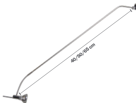
STAS multirail armatura sirius cromata