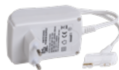
STAS multirail adattatore 18 W VT20500

Consulta le tabelle qui sotto per fare la scelta giusta.