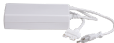
STAS multirail adattatore 96 W VT20300