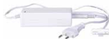
STAS multirail adattatore 36 W VT20036