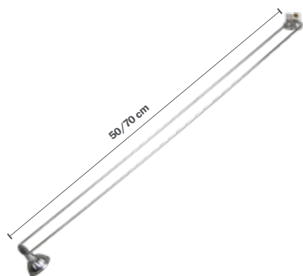
STAS multirail armatura classica cromata