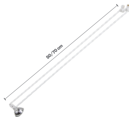
STAS multirail armatura classica bianca