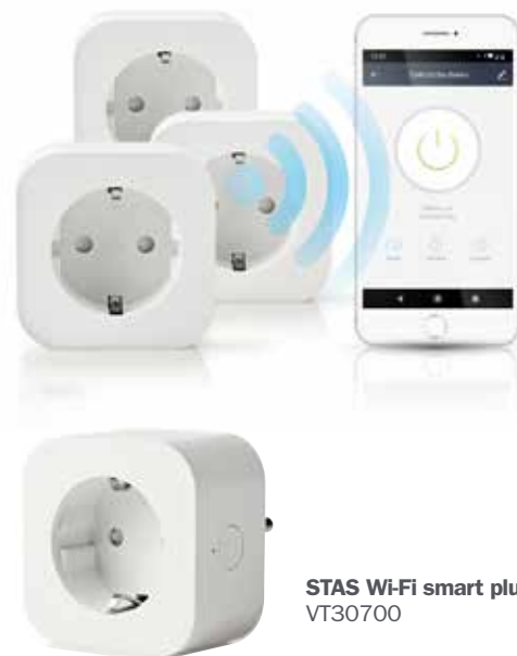
STAS Wi-Fi smart plug VT30700

La STAS Wi-Fi smart plug ha una comoda funzione timer, così lo STAS multirail si accende automaticamente quando torni a casa dal lavoro o quando sei in vacanza. Inoltre, la STAS Wi-Fi smart plug supporta il controllo vocale in combinazione con Amazon Alexa o Google Home.